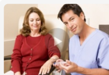
Jak wzmocnić odporność?