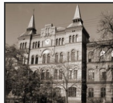
Specjalistyczny Zespół Psychiatrycznej Opieki Zdrowotnej im. A. Demianowskiego przy ul. J. I. Kraszewskiego 25. Dawny Mejski Szpital dla Umysłowo Chorych. Dzisiaj mieści się tutaj psychiatryczny oddział kliniczny.