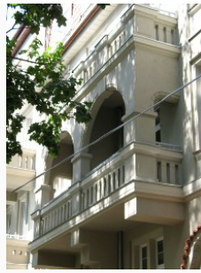
Odrestaurowana elewacja nawiązująca do oryginalnego projektu