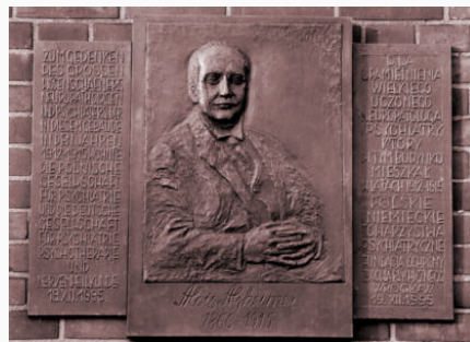
Plata pamiątkowa poświęcona pamięci prof. Aloisa Alzheimera umieszczona na elewacji frontowej dawnej willi dyrektora Kliniki Psychiatrii i Chorób Nerwowych przy ul. O. Bujwida 42 (Auenstrasse 44).