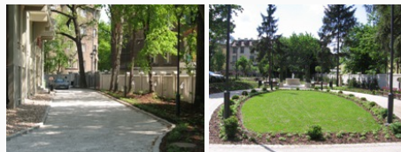
Przejazd pomiędzy bramą wjazdową, wejściem głównym oraz parkingiem Wzrost na ogród terapeutyczny