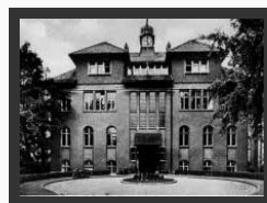
Klinika Psychiatrii i Chorób Nerwowych, Auenstrasse 44 (dzisiaj ul. O. Bujwida 44), fotografia z lat 30. XX wieku. Obecnie: Katedra i Klinika Hematologii i Chorób Rozrostowych Dzieci.