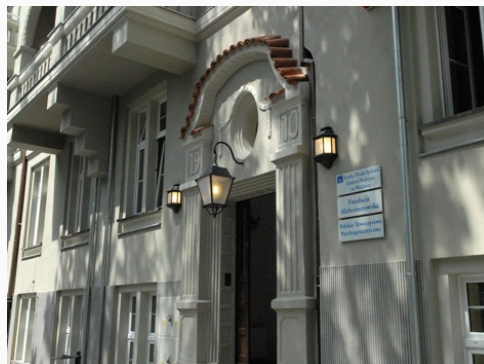
Siedziba Katedry i Kliniki Psychiatrii po zakończeniu prac adaptacyjno-remontowych